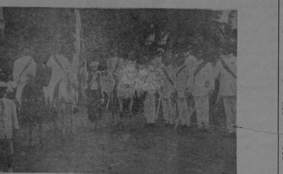
Un pasaje de las fiestas de la coronación que celebró la raza de color el 22 en Limón